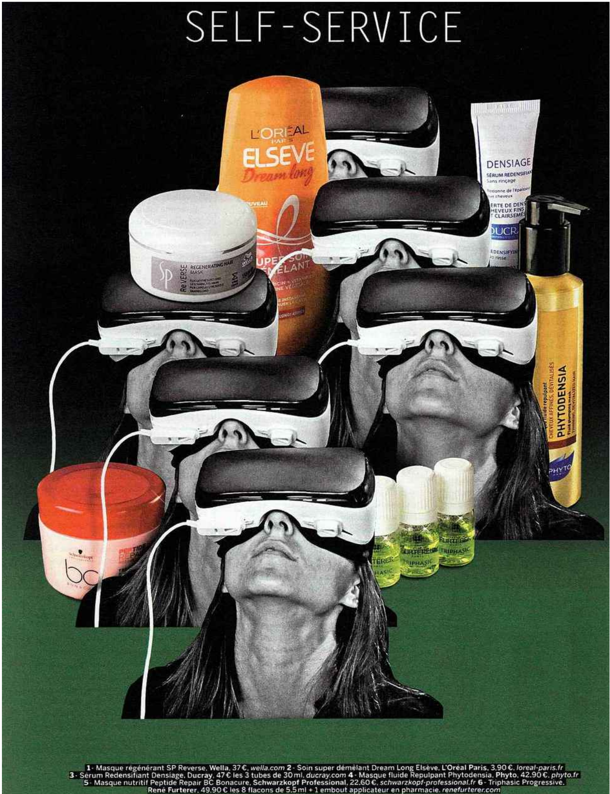
1- Masque régénérant SP Reverse, Wella, 37 €, wella.com 2- Soins super démêlant Dream Long Elseve, L'Oréal Paris, 3,90 €, loreal-paris.fr 3- Serum Redensifiant Densilage, Ducray, 47 € les 3 tubes de 30 ml, ducray.com 4- Masque fluide Repulpant Phytodensia, Phyto, 42,90 €, phyto.fr 5- Masque nutritif Peptide Repair BC Bonacure, Schwarzkopf Professional, 22,60 €, schwarzkopf-professional.fr 6- Triphasie Progressive, René Furterer, 49,90 € les 8 flacons de 5,5 ml + 1 embout applicateur en pharmacie. renefurterer.com